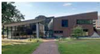
Gemeindehaus Ellerauer Str. 2